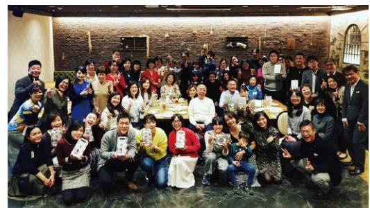
2019.11/30開催「クリスマスパーティー」集合写真

このたびの新型コロナウイルス感染症の影響により、皆さまの健康と安全を最優先に考慮した結果、今年はやむなく開催を中止とさせていただくこととなりました。来年は安心できる環境の中で皆さまにお会いできることを楽しみにしています。一日も早い終息と、皆様のご健康をお祈り申し上げます。